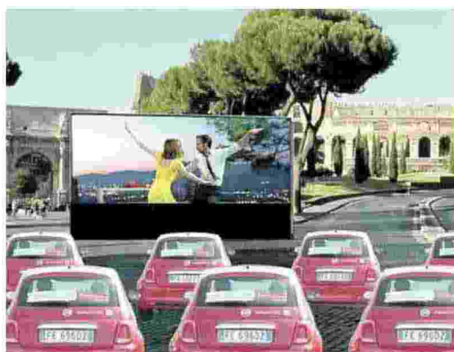
E-DRIVE IN Al Colosseo il 28 ottobre con decine di Fiat 500 Enjoy-Eni